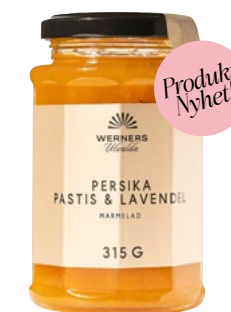
PERSIKA, PASTIS & LAVENDELMARMELAD 315 G Äkta marmelad av persika smaksatt med pastis (fransk anislikör) och lavendel. Smakkombinationen gör att marmeladen passar extra bra att servera till en grönmögelost eller på en croissant.

ART.NR: 46144 | ENHET: STYCK ANTAL/VIKT: 6X315 G