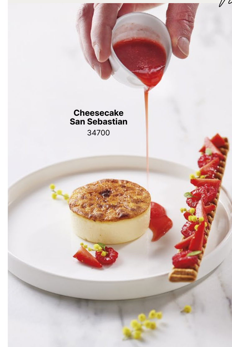
Cheesecake San Sebastian 34700