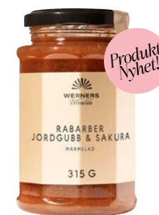
JORDGUBB, RABARBER & SAKURAMARMELAD 315 G Äkta marmelad av söta jordgubbar och grön rabarber, smaksatt med sakura (körsbärsblom). Servera som tillbehör till ost eller på en croissant.

ART.NR: 46146 | ENHET: STYCK ANTAL/VIKT: 6X315 G