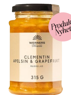
CLEMENTIN, APELSIN & GRAPEFRUKTMARMELAD 315 G Äkta marmelad med fruktkött och skal av clementin, apelsin och grapefrukt där skalen ger en hög citrusbeska. Passar utmärkt som tillbehör till ost eller för att smaksätta säs till anka.

ART.NR: 46145 | ENHET: STYCK ANTAL/VIKT: 6X315 G