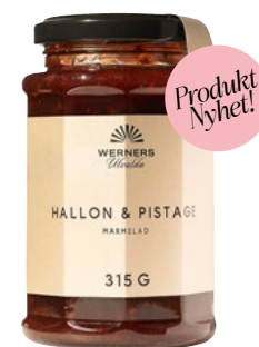
HALLON & PISTAGELMARMELAD 315 G Äkta marmelad med hög halt hallon och smak av pistagenöt. Servera som tillbehör till ost eller på en croissant.

Ett sött tillbehör som lyfter ostbrickan, en självklarhet till scones och rostat bröd eller som fyllning i kakor eller tårtor - marmelad har många användningsområden. Vi lanserar fyra marmelader med tydlig fruktkaraktär och spännande smakkombinationer. Citrusmarmeladen görs på clementin, apelsin och grapefrukt och har en frisk citrusbeska från skalen. Hallonmarmeladen samsas med pistagenöt för en bärig och nötig smak. Marmeladen av söta jordgubbar och grön rabarber har fått en elegant ton av sakura (körsbärsblom) och vår nya persikomarmelad smaksätts med de klassiskt franska smakerna pastis och lavendel.